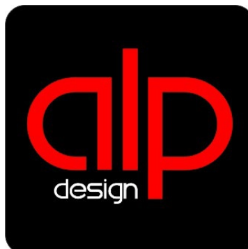
LOGO ATTUALE Introdotta nel 2021