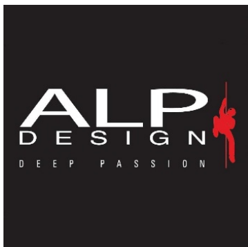
LOGO STORICO Utilizzato dal 1978 al 2020